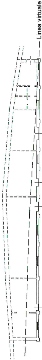
PIANO TERRA H: 3,50