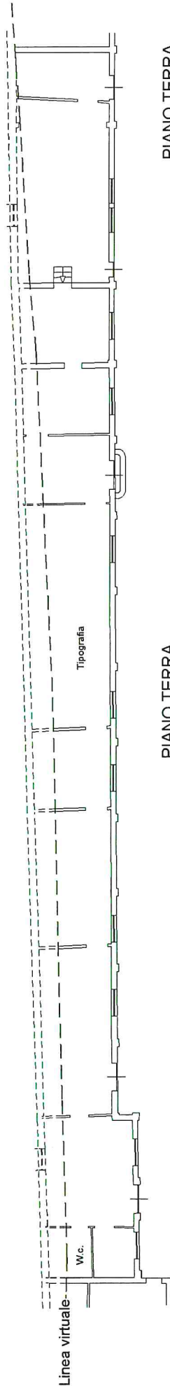
PIANO TERRA H max. 5,80 - H min. 4,30